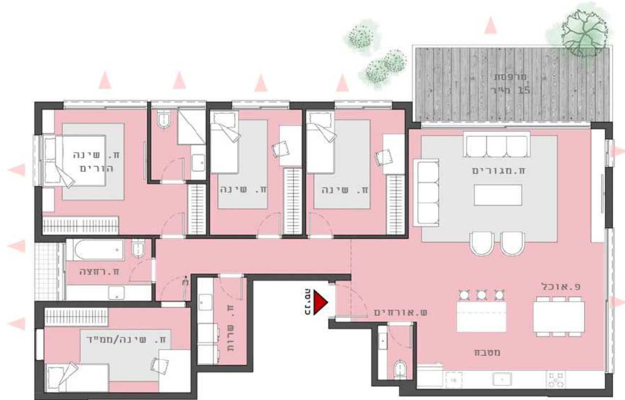
חלופת 5 חדרים C2 145 מ"ר + 15 מ"ר מרפסת שנוש - תוספת 40 מ"ר