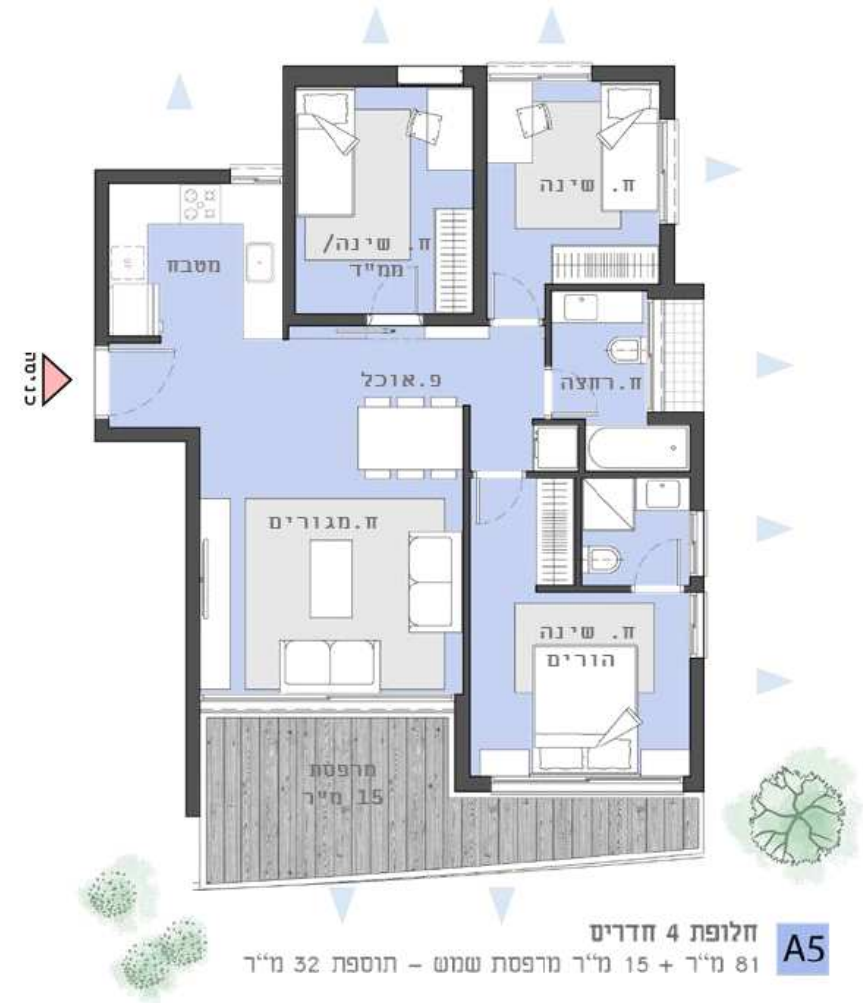
חלופת 4 חדרים 81 מ"ר + 15 מ"ר מרפסת שמש - תוספת 32 מ"ר A5

התכנים המובאים בתכנית הינם לצרכי שיווק בלבד ואינם מהווים הצעה מחייבת ו/או התחייבות כלשהי כלפי מאן דהוא, לרבות בקשר עם מפרטים, כיוונים, רישומים, איורים, וכל אלמנט אחר כלשהו ואלה נתונים וכפופים לשינויים לפי שיקול דעתם הבלעדי של היזמים. כמו כן, התוכנית הכלולת בחוברת זו אינן סופיות וניתנות לשינוי לפי שיקול דעתם הבלעדי של היזמים, לרבות בהתאם לדרישות היתר הבניה שיתקבל. היזמים יהיו מחויבים רק עפ"י מפרט המכר ותוכנית המכר הסופיים אשר יימסרו לבעלי הזכויות ע"י היזמים בהתאם להוראות ההסכם. העושה שימוש במידע ו/או המקבל החלטותיו על סמך המידע המופיע בחוברת זו, עושה זאת על אחריותו בלבד והוא מוותר על כל דרישה ו/או טענה ו/או תביעה כלפי היזמים בכל הקשור והכרוך בהסתמכות על המידע בחוברת זאת. כל הזכויות שמורות - טל"ח.