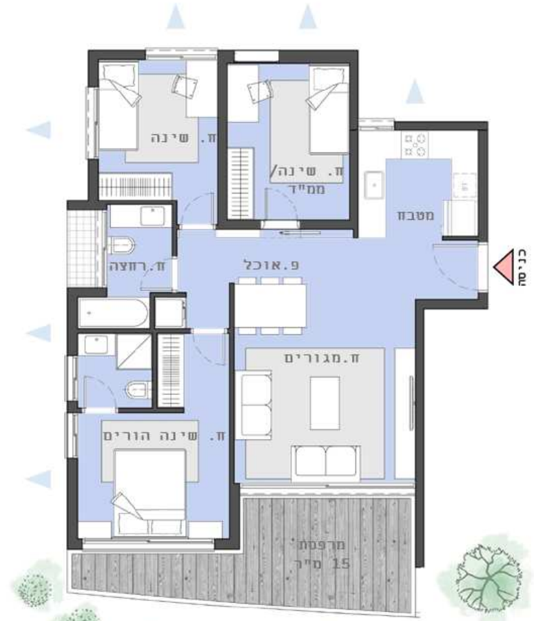
חלופת 4 חדרים

81 מ"ר + 15 מ"ר מרפסת שנוש - תוספת 32 מ"ר